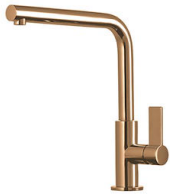
Mischbatterie Omega Copper